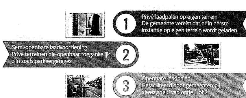
Figuur 1: Ladder van laden

Voor het laden van elektrische auto’s wordt vaak uitgegaan van de zogeheten ‘ladder van laden’, zie figuur 1 hieronder.